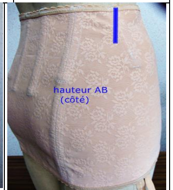
hauteur AB (coté)