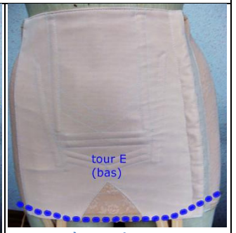
tour E (bas)

mesure à renseigner en cas de ventre bombé