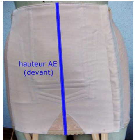
hauteur AE (devant)