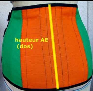
hauteur AE (dos)

placer le mètre ruban sur les fesses (en haut du pli fessier) et remonter sur le dos (en suivant la courbure) jusqu'en haut du produit (position : taille ou sous poitrine... en fonction de la hauteur souhaitée)