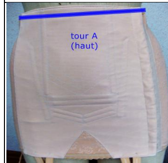
tour A (haut)

placer le mètre ruban sur les fesses (en haut du pli fessier) et remonter sur le dos (en suivant la courbure) jusqu'en haut du produit (position : taille ou sous poitrine... en fonction de la hauteur souhaitée)