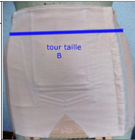
tour taille B

exemple de formulaire avec valeurs saisies (rouge)