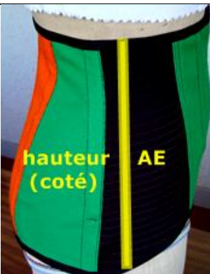
hauteur AE (coté)

mesure à renseigner en cas de ventre en tablier (tombant)