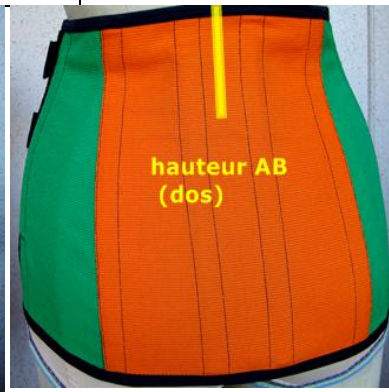
hauteur AB (dos)