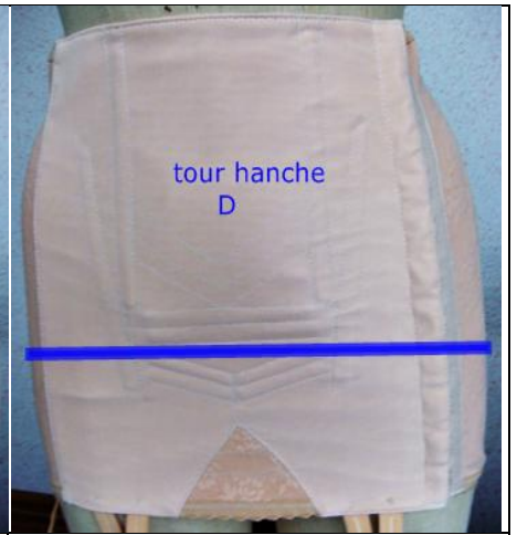
tour hanche D