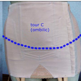
tour C (ombilic)

mesure à renseigner en cas de ventre bombé