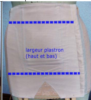
largeur plastron (haut et bas)